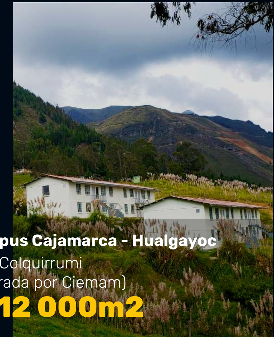
Campus Cajamarca - Hualgayoc U.M. Colquirrumi (Operada por Ciemam) +112 000m 2